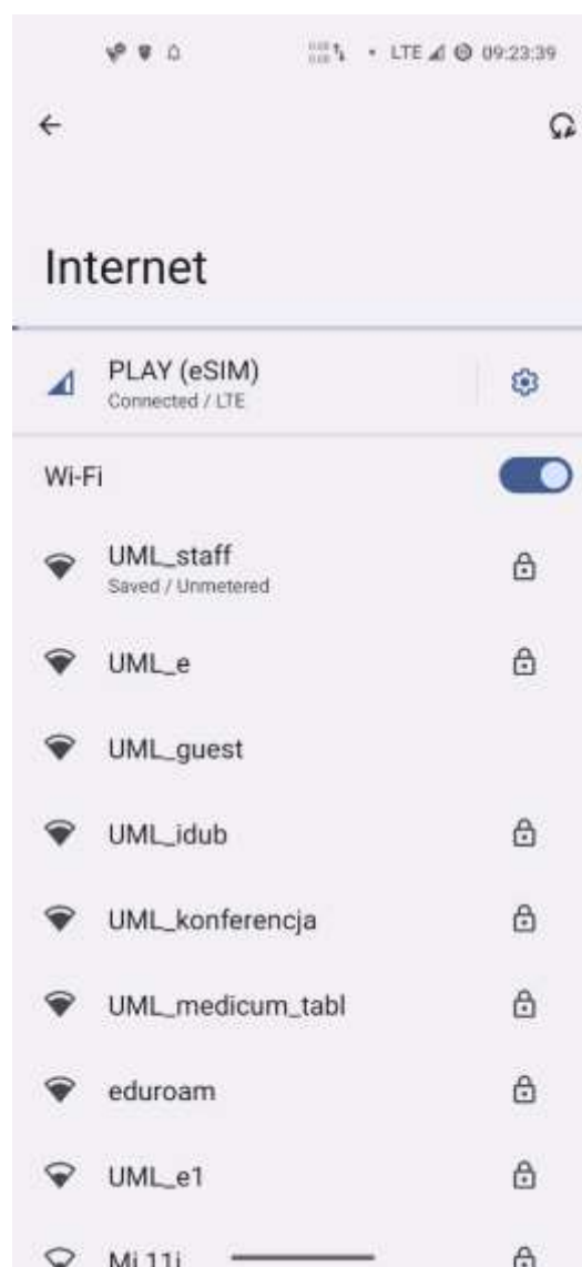
Rys. 1 – Lista dostępnych sieci WiFi z widoczną siecią eduroam .