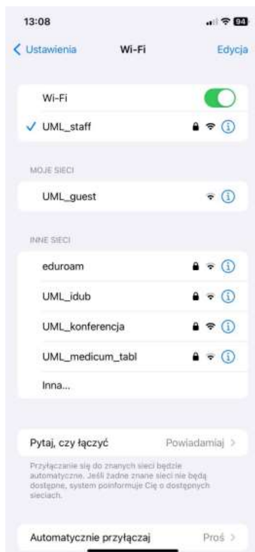
Rys. 1 – Lista dostępnych sieci WiFi z widoczną siecią eduroam .