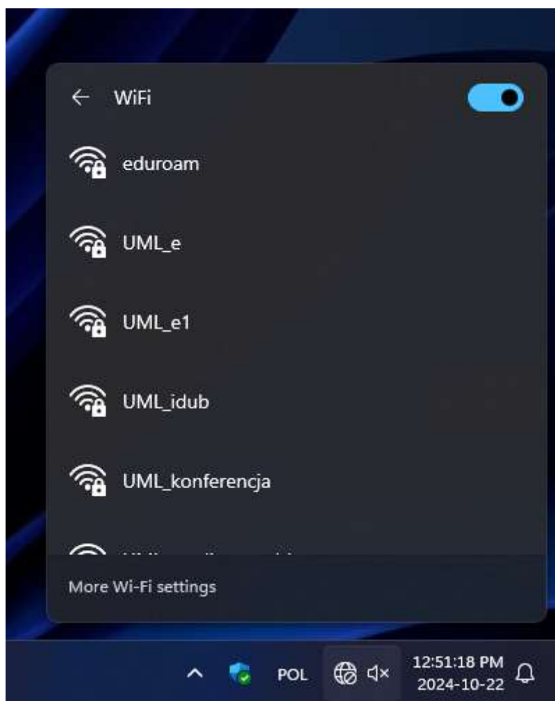
Rys. 1 – Lista dostępnych sieci WiFi z widoczną siecią eduroam .