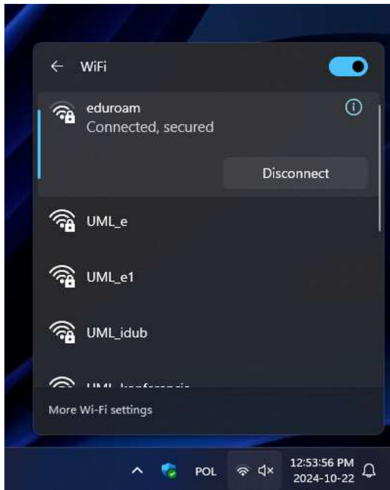
Rys 6. – Prawidłowe podłączenie do sieci eduroam .