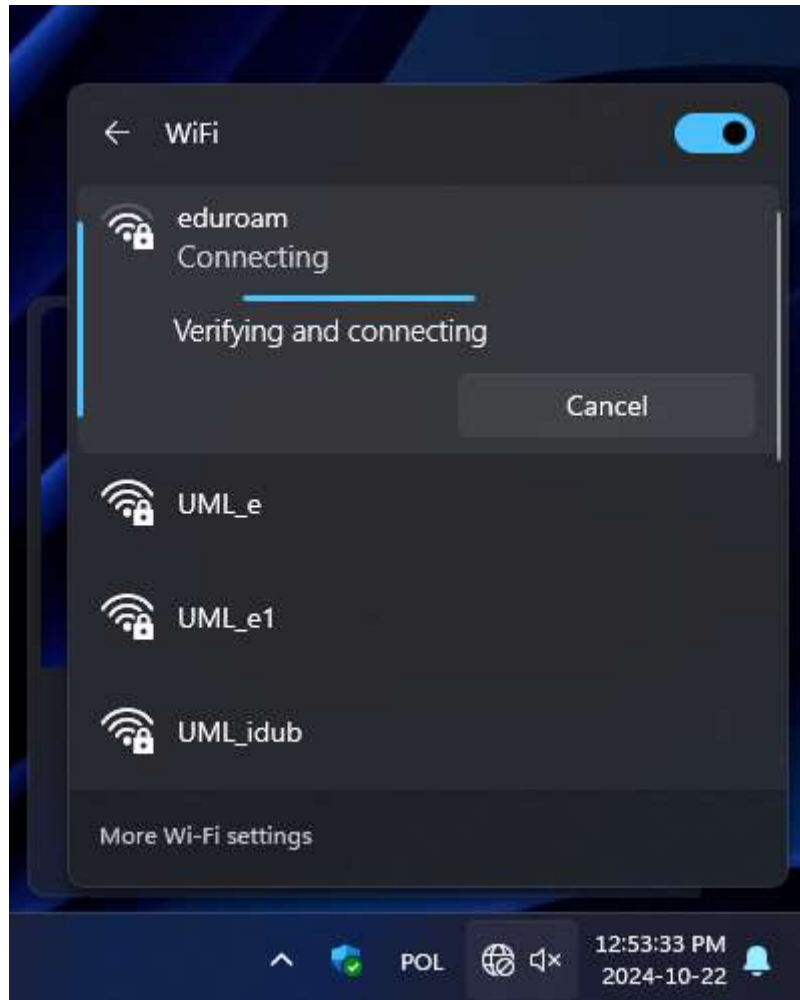
Rys. 5 – Weryfikacja podanych danych logowania.