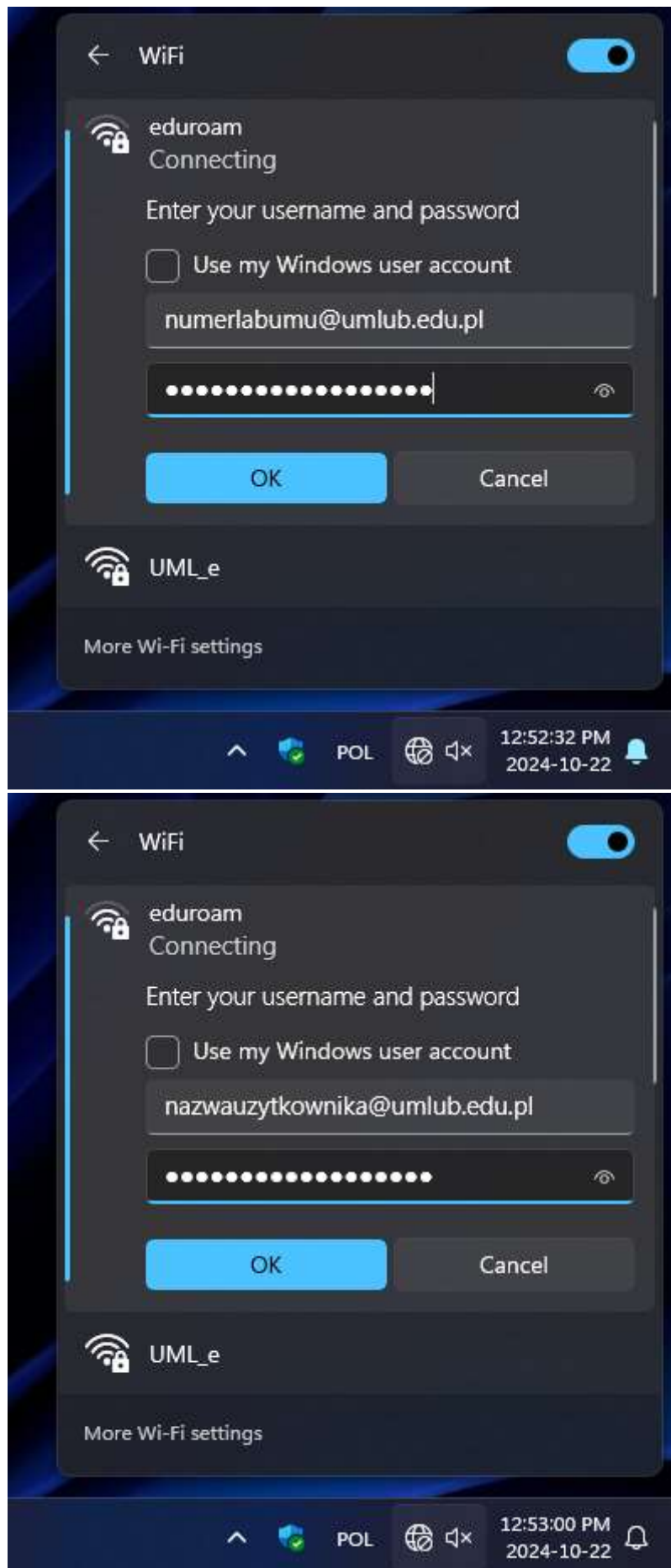
Rys. 4 – Przykładowo podane dane z podświetlonym przyciskiem OK .