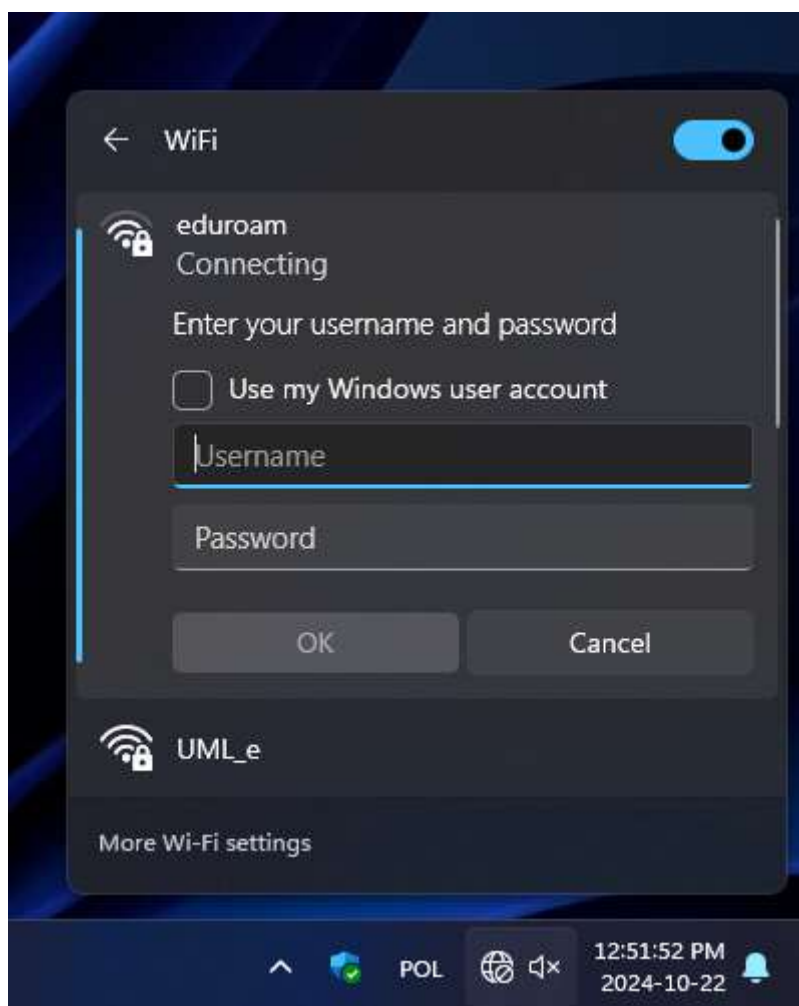
Rys. 3 – Komunikat o podanie loginu i hasła.